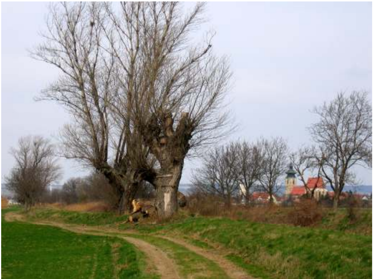
Blick auf die Pillichsdorfer Kirche von unterwegs

Gasthäuser und Heurige in Pillichsdorf und Großengersdorf.