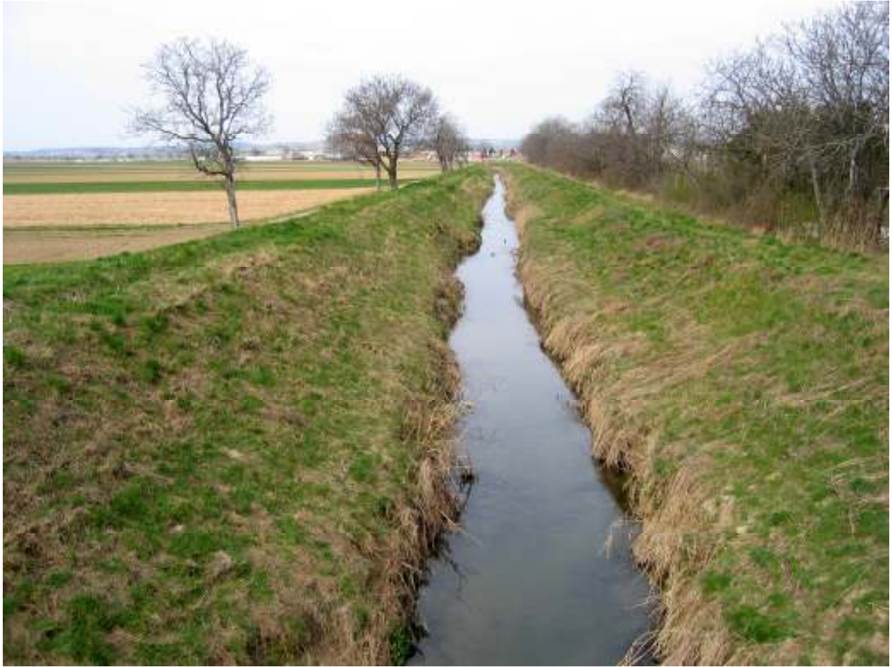
Blick von der Brücke bei Pillichsdorf nach Norden den Russbach hinauf