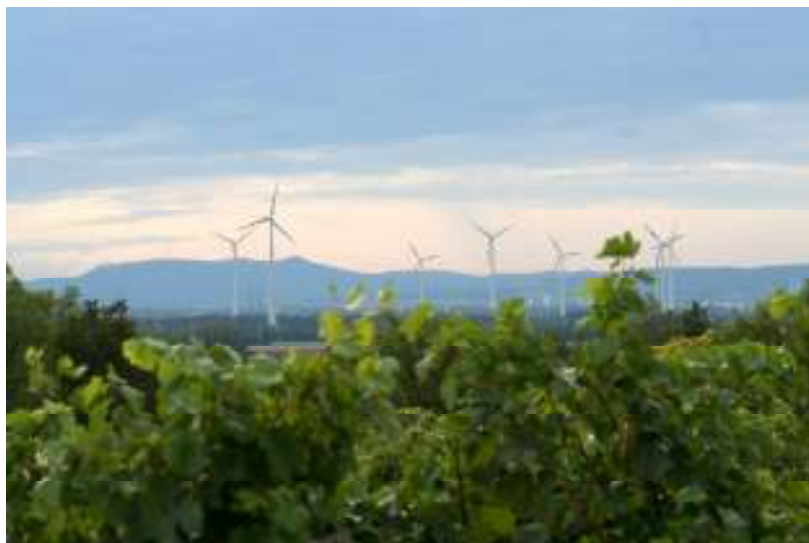
Blick nach Wien vom Großengersdorfer Spaziergang

Vom Bahnhof rechts die Bahnstrasse hinauf, an der Kirche vorbei zur Hauptstrasse. Diese überqueren, links Richtung Pillichsdorf bis zur nächsten rechts abbiegenden Kreuzung. Hier folgt man der Strasse schräg links (nicht rechts in die Spitalgasse) geradeaus, bei der nächsten Kreuzung, den Satzgraben rechts liegen lassend, geradeaus auf den Stallberg. Die nächste Gasse auf dem Güterweg rechts abbiegen und mit Sicht auf Großengersdorf geradeaus bis der Weg endet. Hier rechts bis zur Hauptstrasse und gleich wieder geradeaus in den Satzgraben. Entlang dieser Kellergasse bis zum Ende, links ab zur Hauptstrasse und in die Andreasgasse einbiegen. Dann rechts in die Neustiftgasse bis zur Kirche. Dort rechts bis zum Bahnhof.